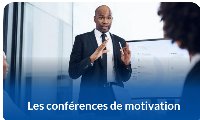
Les conférences de motivation