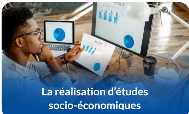
La réalisation d'études socio-économiques