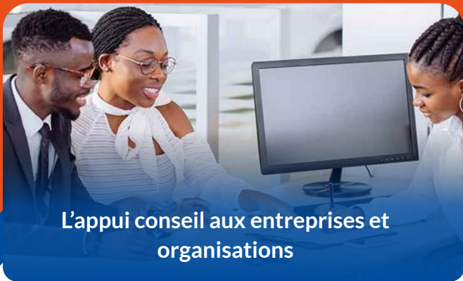
L'appui conseil aux entreprises et organisations